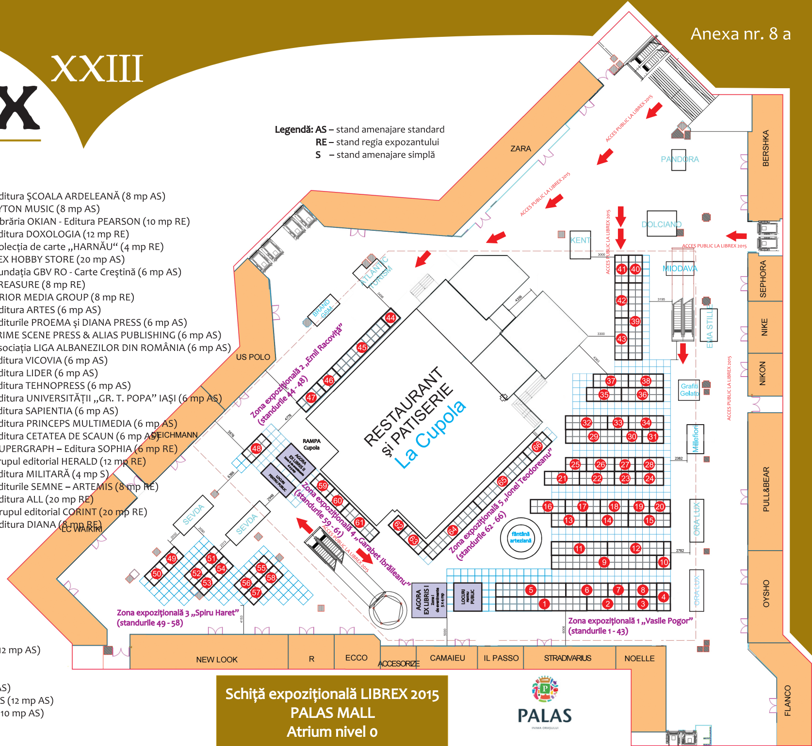
Schiță expozițională LIBREX 2015 PALAS MALL Atrium nivel 0

Legendă: AS – stand amenajare standard RE – stand regia expozantului S – stand amenajare simplă